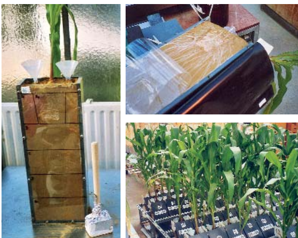
Großbeerener Forscher sehen das Gras von unten wachsen. Die Fotos zeigen Maispflanzen, die in lange, flache Kästen gepflanzt wurden, deren Vorderseite mit einer Glasplatte versehen ist. Stellt man diese Pflanzgefäße schräg auf (Glasplatte zeigt nach unten; Foto unten rechts), so wachsen besonders viele Wurzeln direkt hinter der Glasscheibe und lassen sich gut in ihrem Wachstum beobachten. Für das Foto oben rechts wurde die Glasplatte abgeschraubt.

Am IGZ ist es bereits mehrfach gelungen, Mikroorganismen mit derartigen Eigenschaften aus der Rhizosphäre zu isolieren und im Labor zu